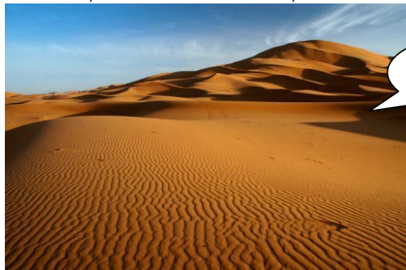
the Sahara Desert