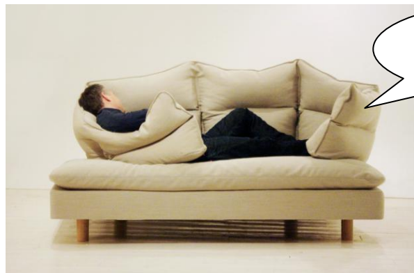
the most comfortable sofa

Як правило, артиклі використовуються перед іменниками або перед прикметниками, які стоять перед іменниками. Але це не у випадку прикметників у найвищому ступені порівняння - усі вони вживаються із означеним артиклем "the": the best (найкращий), the strongest (найсильніший), the most comfortable (найзручніший), the biggest (найбільший).