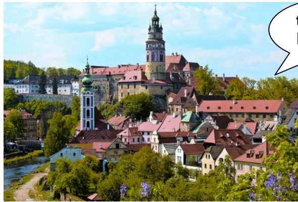
the Czech Republic