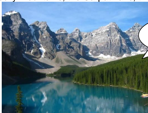
the Rocky Mountains